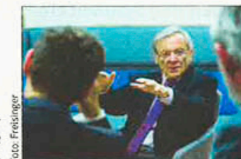
W. Schüssel über unsere Zukunft

Leoben. Im Trofaiacher Stockschloss diskutierte der ehemalige Bundeskanzler Wolfgang Schüssel im Rahmen der Veranstal-