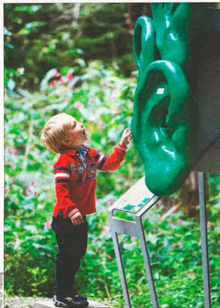
Der Erlebnisweg bietet Spaß und Spannung für Groß und Klein.